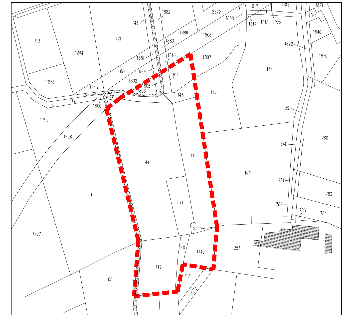
Estratto mappa catastale

----- Perimetro Piano Attuativo denominato "EP5"