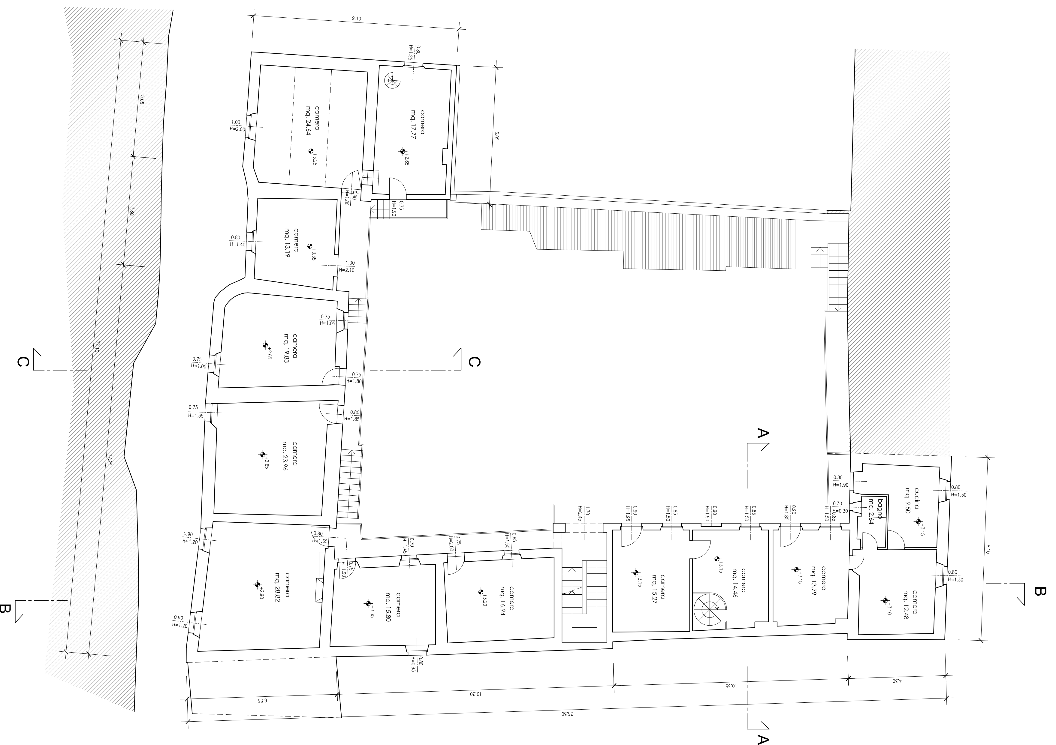
Pianta Piano Primo