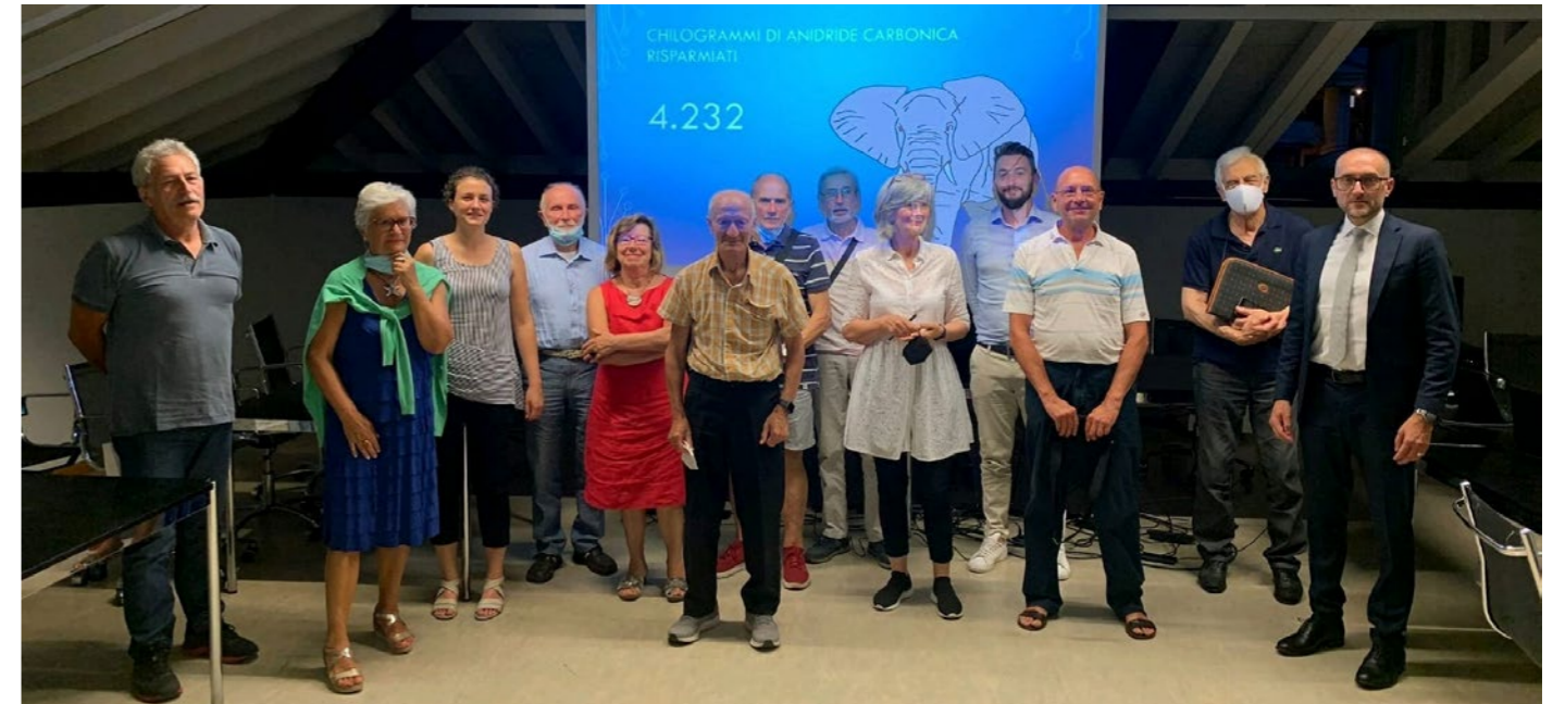
Partecipanti in presenza all'ultima edizione del Percorso di Supporto Digitale

"La strategia è quindi quella di partecipare a diversi bandi volti a migliorare i servizi che già abbiamo attivi o ad svilupparne di nuovi, come il rinnovo del nostro gestionale a livello informatico", aggiunge Locatelli.